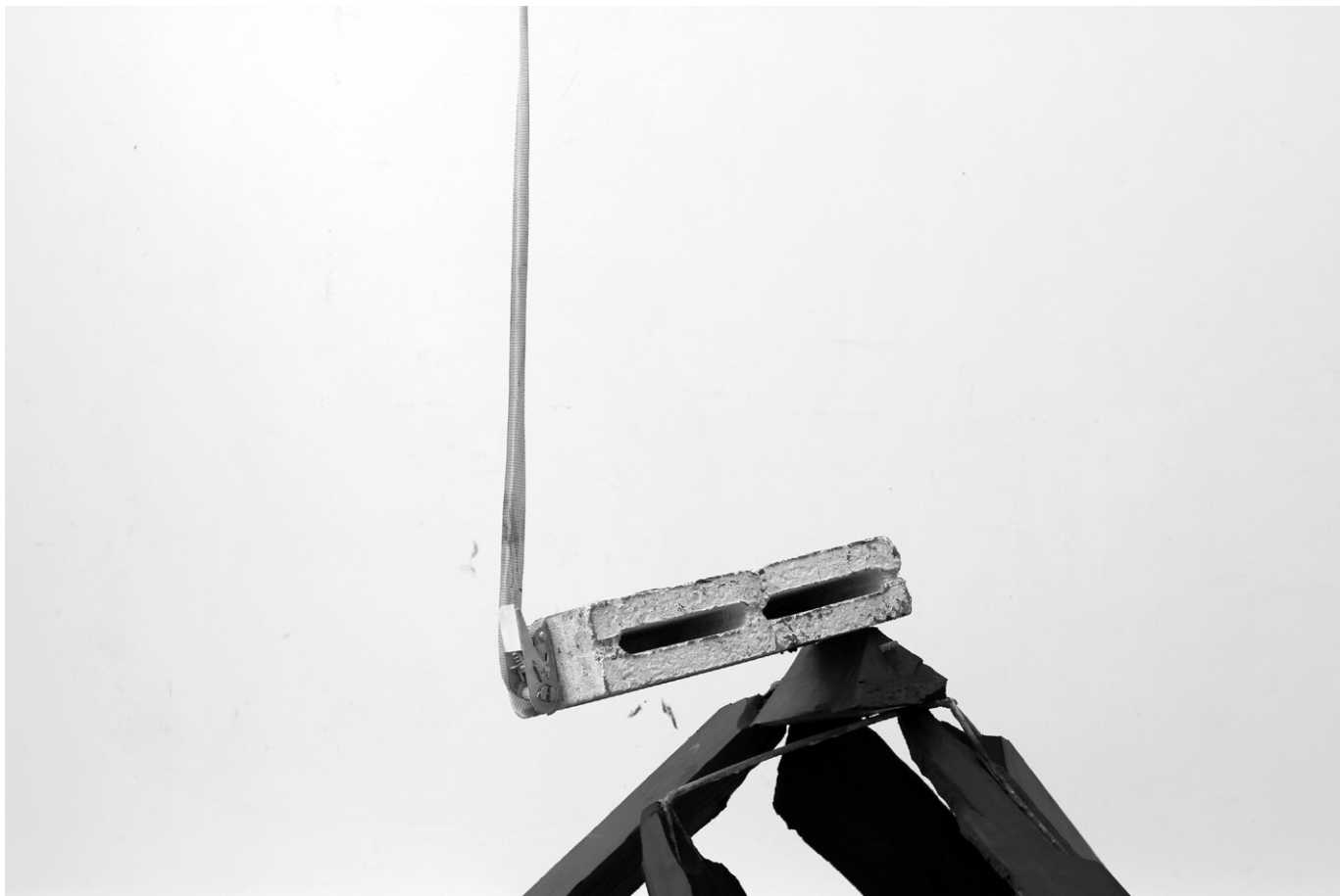
La Naïveté d'Adam (2013) Photographie numérique exemplaire unique