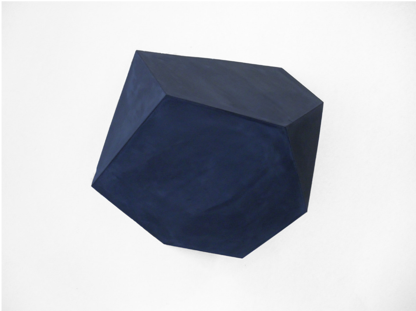
Éléments pour un ensemble (2013) plâtre pigmenté 67 x 74 x 42 cm