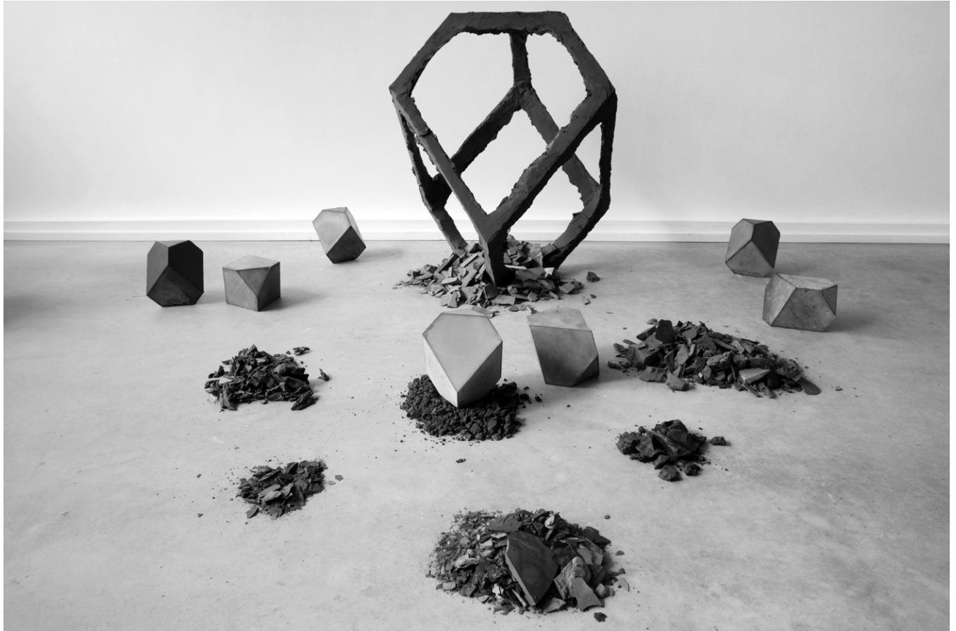
Éléments pour un ensemble (2013) plâtre pigmenté dimensions et propositions variables