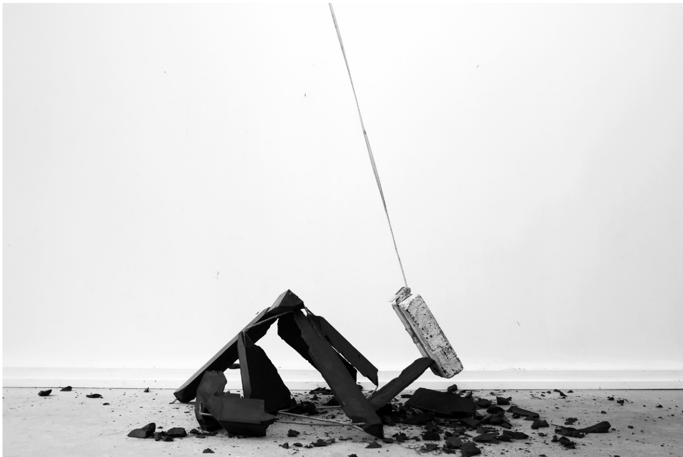
La Naïveté d'Adam (2013) Photographie numérique exemplaire unique