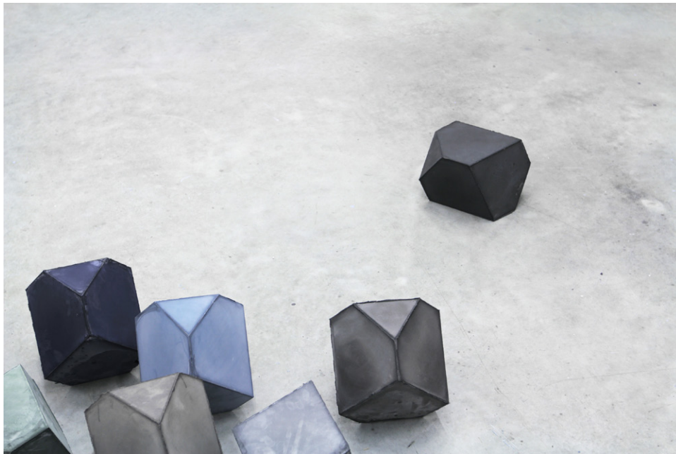
Éléments pour un ensemble (2013) plâtre pigmenté dimensions et propositions variables