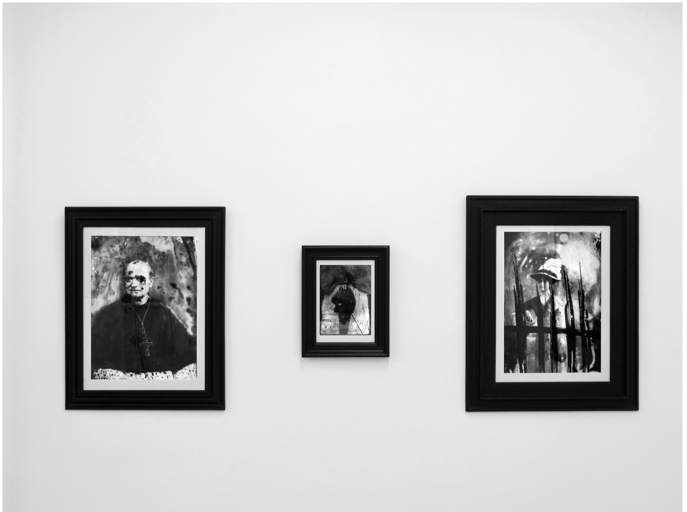
Vue de l'exposition Surface volume virtuel (2011)