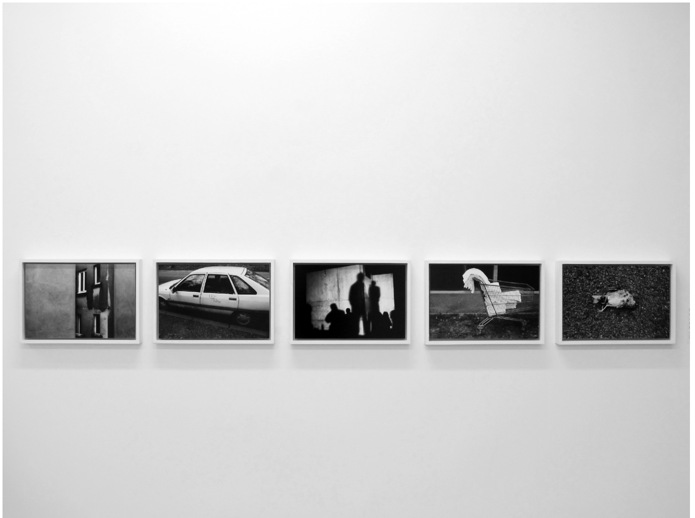
Vue de l'exposition Surface volume virtuel (2011)