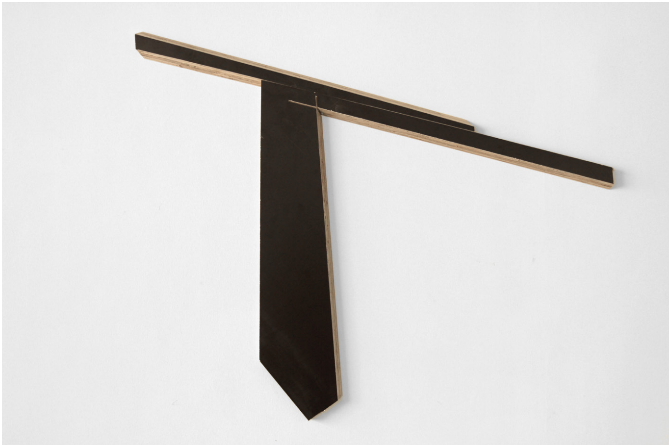
Éléments pour un ensemble (2013) Bois bakéliné 82 x 102 cm