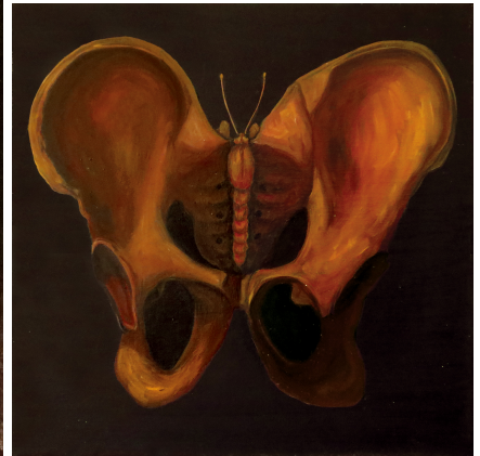
Les Métamorphoses 1,2,3 – Huile sur toile – 30 x 30 cm chaque - 2013