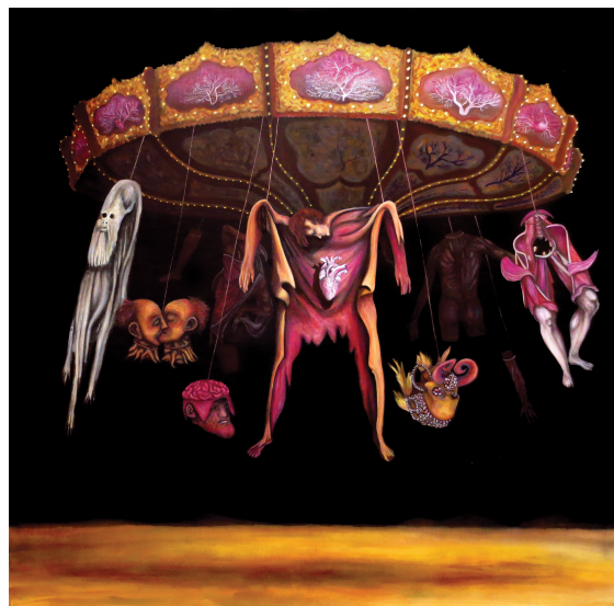
Tourniquet 2 – Huile sur toile – 140 x 140 cm – 2013

19, rue chapon 75003 paris 09 83 56 66 60 - 06 68 70 97 19 contact@maiamuller.com www.galeriemaiamuller.com