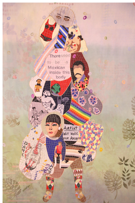
Familia Californinana a 6 colores , Residence MOLAA (Museum of Latin American Art), 2019