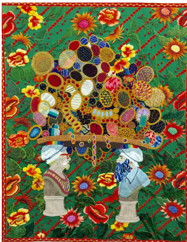
Chiachio & Giannone, 2012, Enmaranados , Broderie à la main, rayon, laine et fil à broder effet lumière sur tissus à motifs, 1,08 x 1,42 m. | Lyonais , 2016