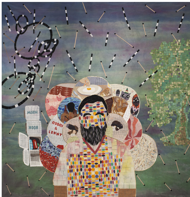
Familia a 6 colores, Résidence Centre Culturel Kirchner, 2018.