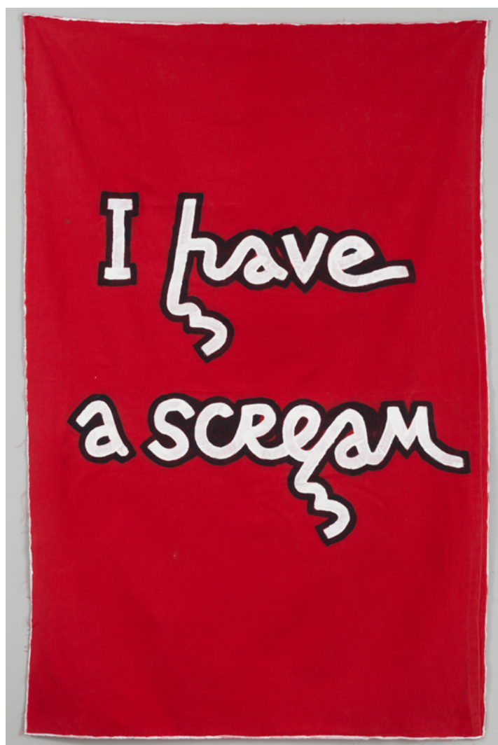
Babi Badalov, I Have a Scream , 2023 - Peinture sur tissu, 123 x 80 cm - Courtoisie de l'artiste et de la Galerie Poggi, Paris. Photo ©.kit.

Actual Azerbaijani Art , Aydan Gallery, Moscow (RU)