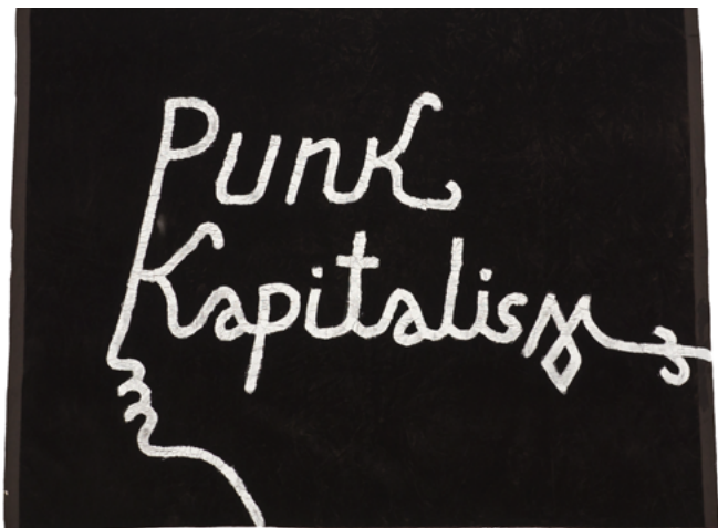
Babi Badalov Punk Kapitalism , 2019 Peinture sur tissu, 62 × 92 cm Courtoisie de l'artiste et de la Galerie Poggi, Paris