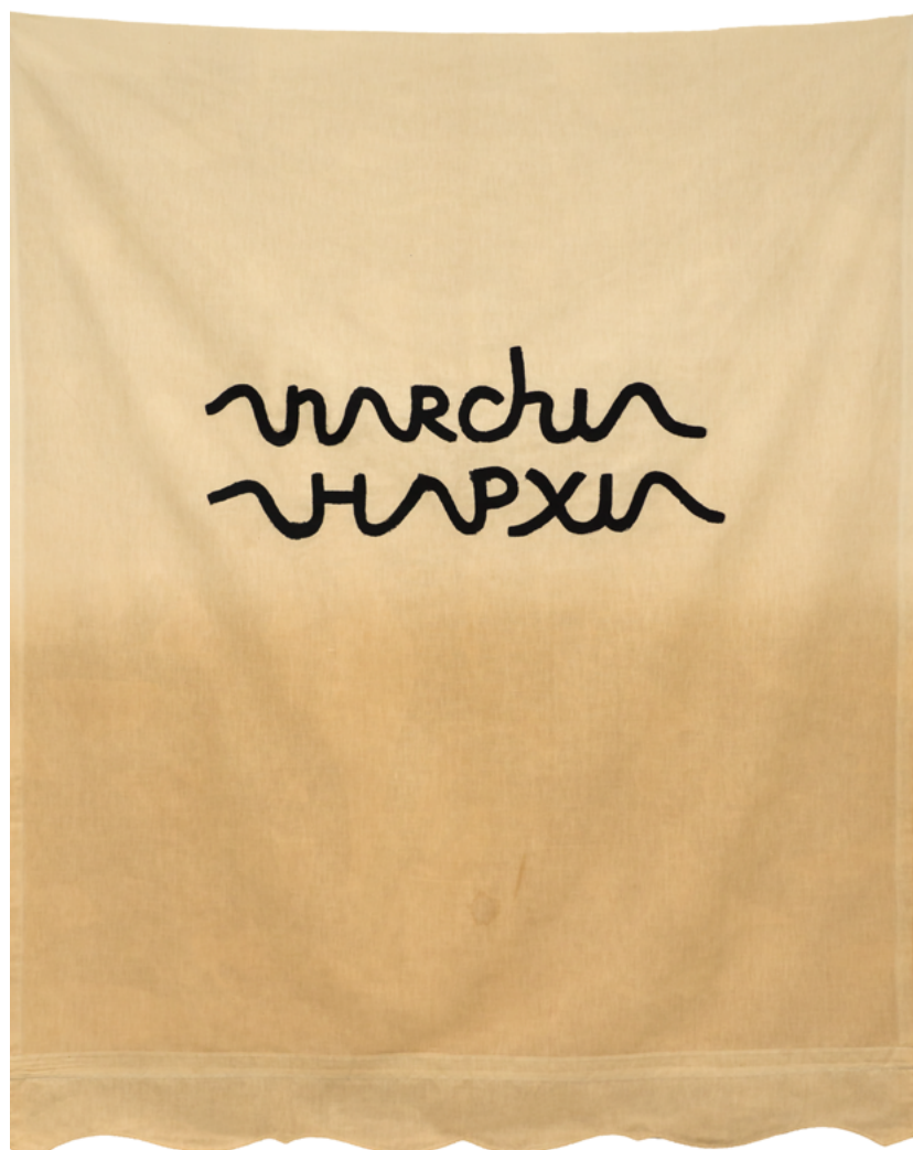
Babi Badalov, anarchi , 2020 - Peinture sur tissu, 178 × 146 cm

Art is Myth, I am Real, Galerie Jérôme Poggi, France, (FR)