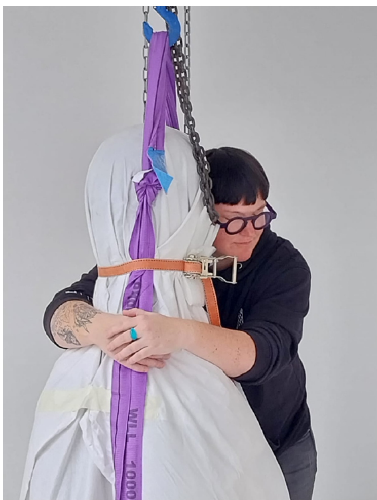
Portrait de Julie Crenn, montage de l'exposition Inner Powers , Transpalette, Bourges, juin 2024

J'ai pensé l'espace comme un vortex pour que le public puisse s'immerger dans la poésie visuelle de Babi Badalov. Cela passe non seulement par la présence des œuvres, mais aussi par la circulation des corps dans l'espace d'exposition. Deux murs forment une lettre V, un entonnoir qui impose un point de vue dès notre entrée dans l'exposition. À nous de choisir d'entrer dans l'entonnoir (dont l'intérieur est peint en noir) ou de la contourner (l'extérieur est peint en blanc). Le point de vue imposé dès l'entrée, mène notre regard