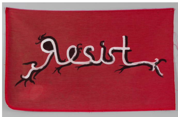
Babi Badalov Resist , s.d. Peinture sur tissu, 87 x 53 cm Courtoisie de l'artiste et de la Galerie Poggi, Paris. Photo ©.kit.