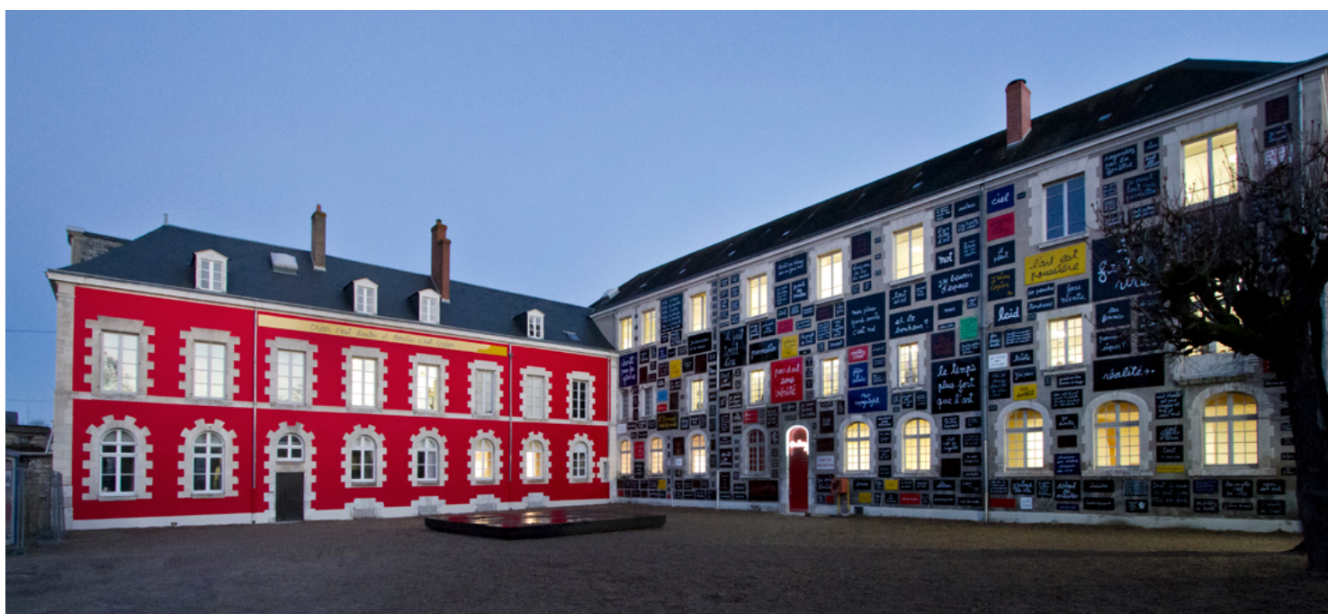
Vue générale de la cour du doute