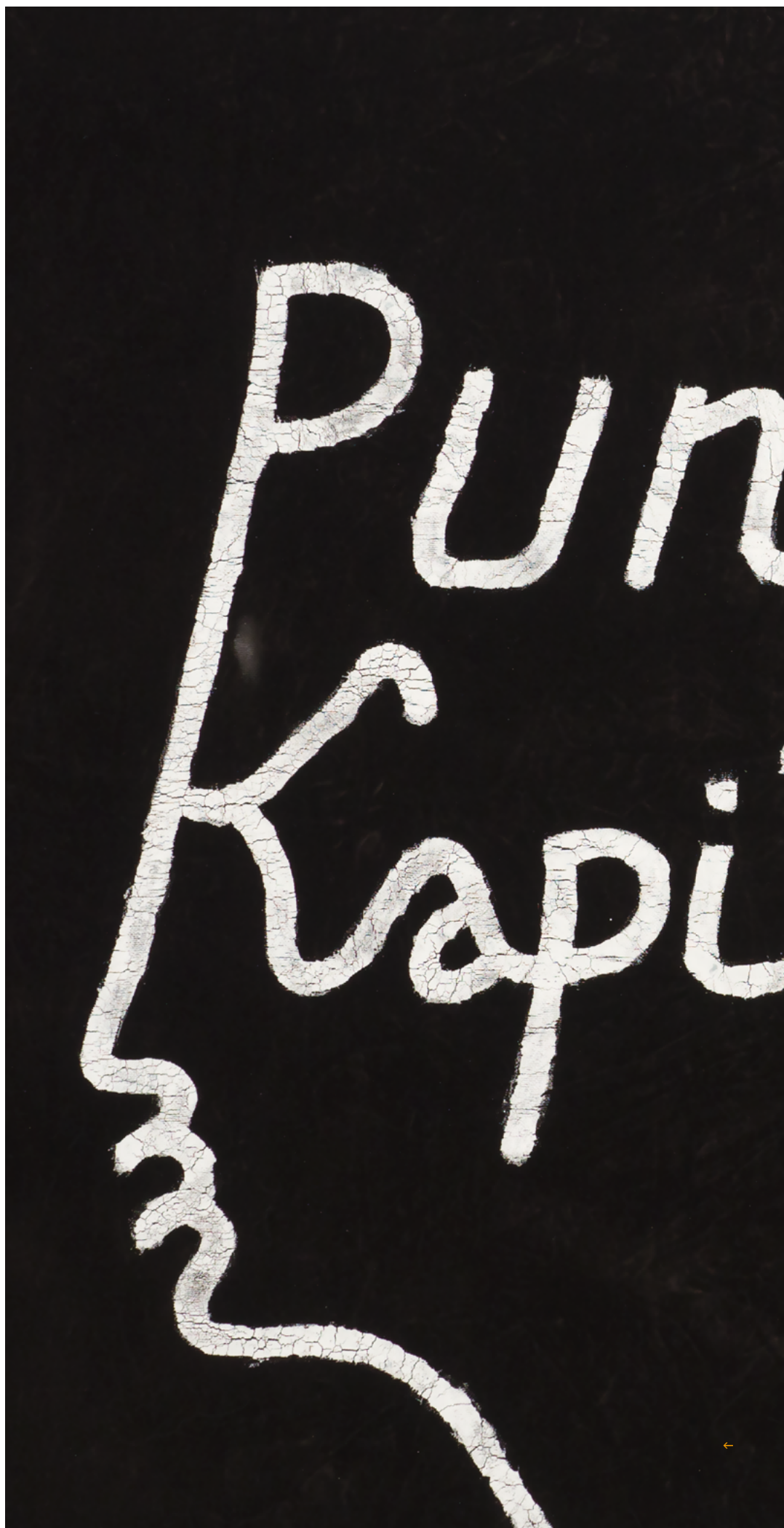
Babi Badalov Punk Kapitalism (détail), 2019 Peinture sur tissu, 62 × 92 cm