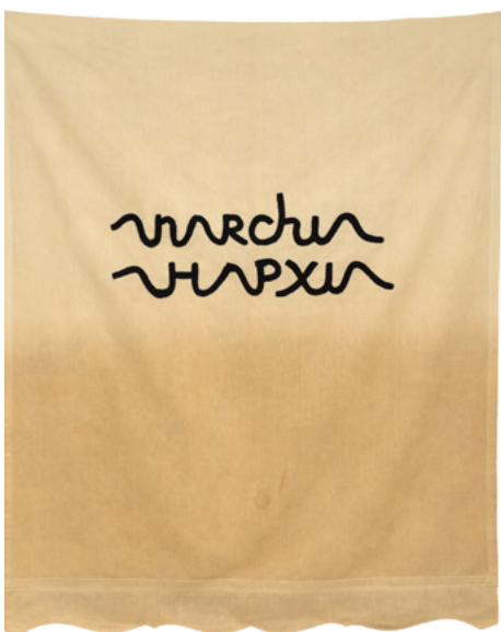
Babi Badalov anarchi , 2020 Peinture sur tissu, 178 × 146 cm