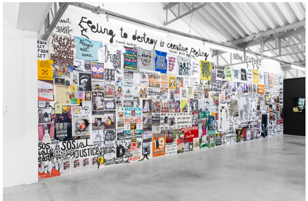
Vue de l'exposition Salut à toi , Centre d'Art Transpalette, Bourges (FR), 2024

Human Condition - Biography: a model kit, Moscow Museum