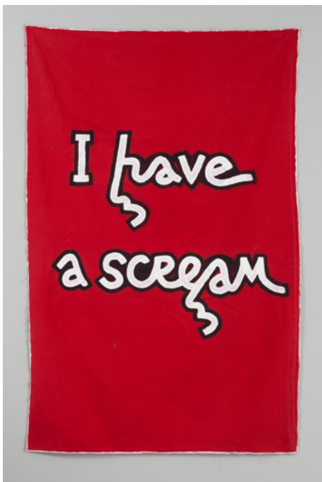
Babi Badalov I Have a Scream , 2023 Peinture sur tissu, 123 x 80 cm Courtoisie de l'artiste et de la Galerie Poggi, Paris. Photo ©.kit.