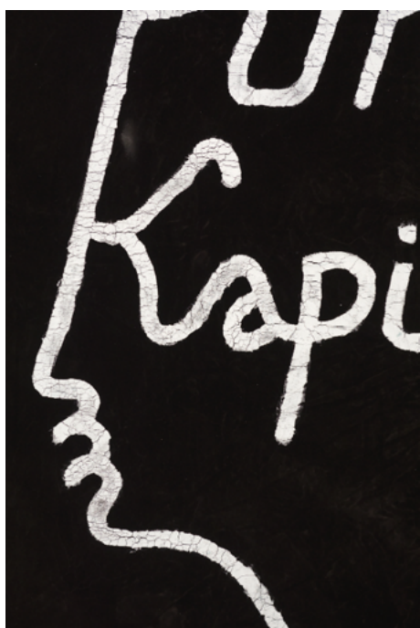
Babi Badalov Punk Kapitalism (détail) , 2019 Peinture sur tissu, 62 × 92 cm